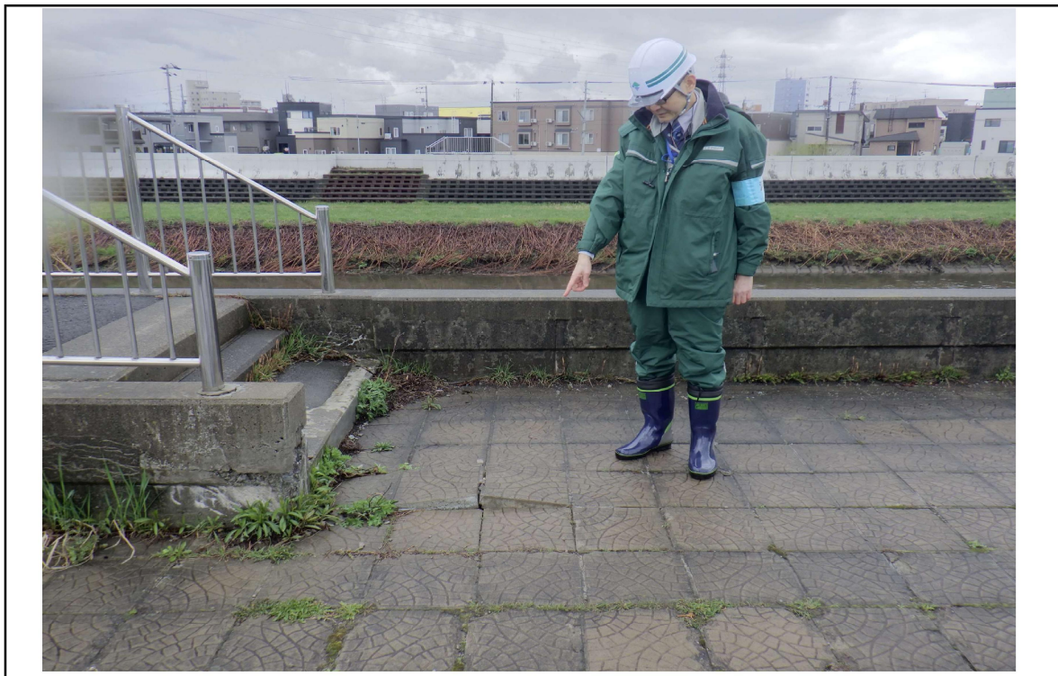
○撮影場所：望月寒川左岸KP1.8付近 ○写真説明：平板ブロック浮き上がり