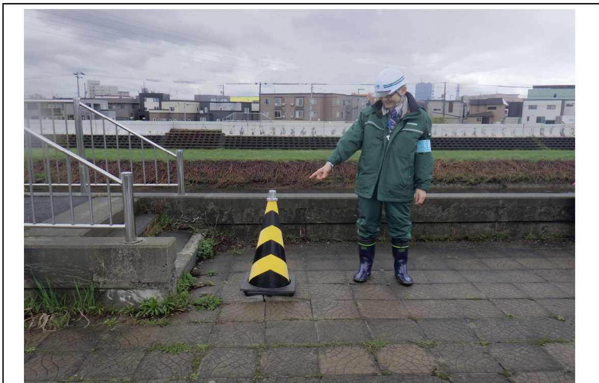
○撮影場所：望月寒川左岸KP1.8付近 ○写真説明：平板ブロック浮き上がり