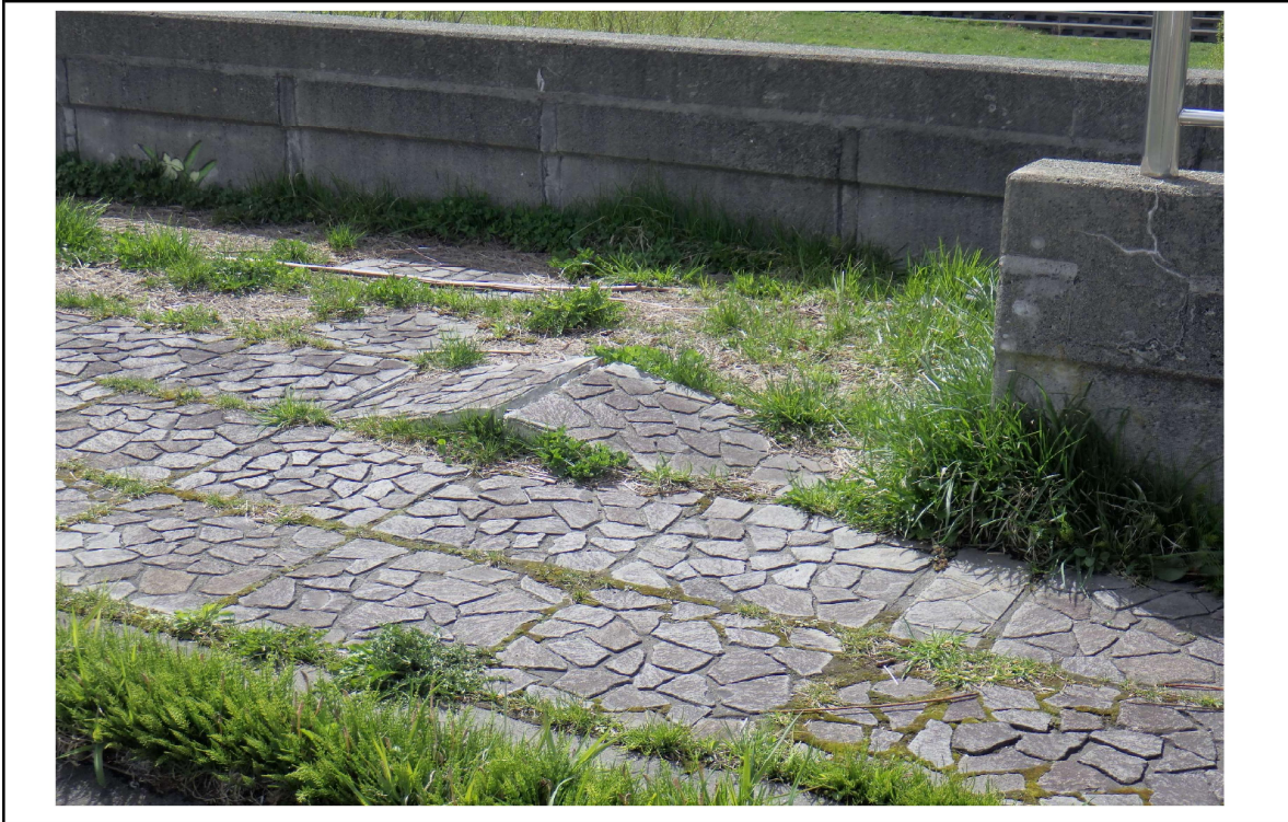
○撮影場所 : 月寒川右岸KP2.1 ○写真説明 : 平板ブロック浮き上がり