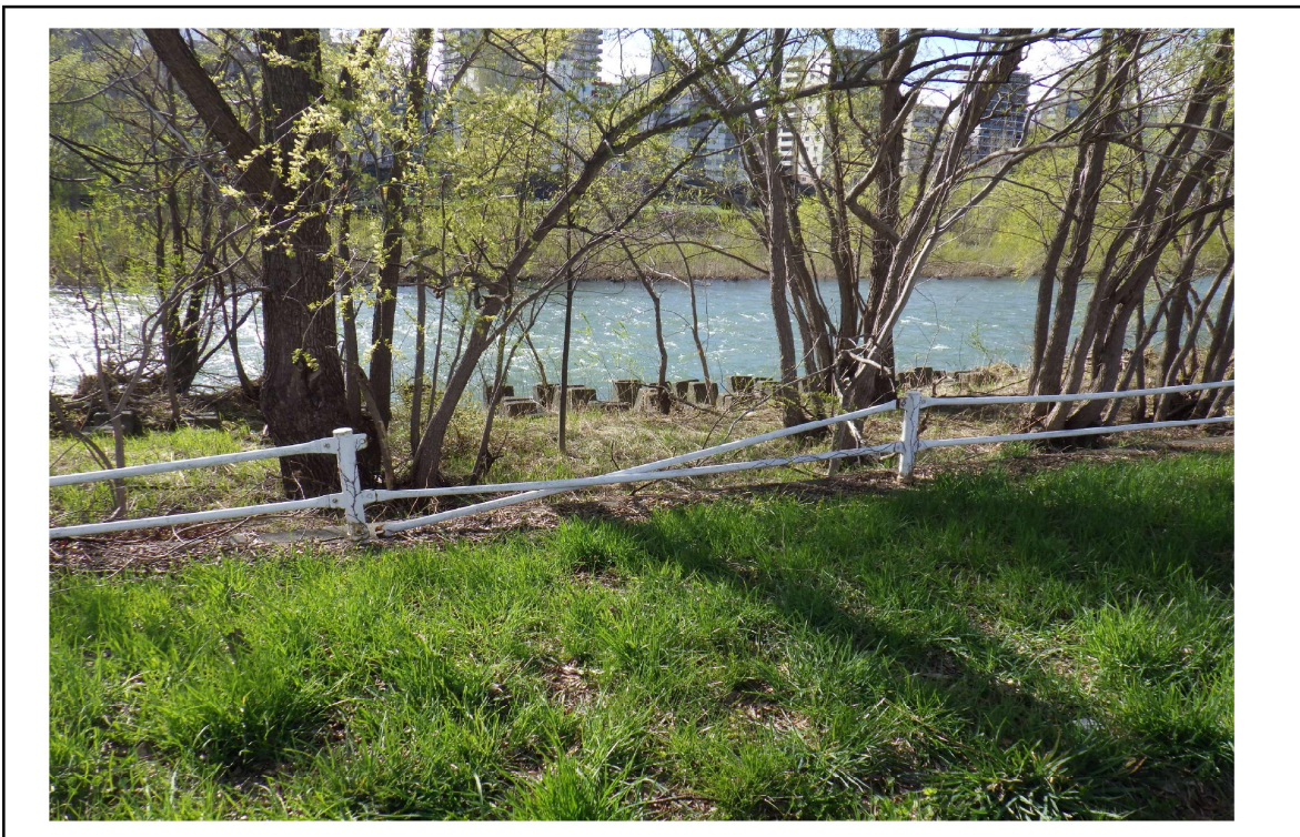
○撮影場所 : 豊平川右岸KP16.1付近 ○写真説明 : 柵の損傷