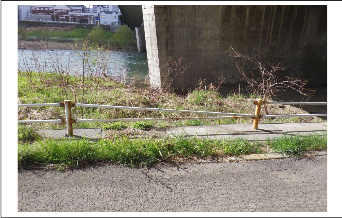
○撮影場所 : 豊平川右岸KP14.7付近 ○写真説明 : 柵の損傷