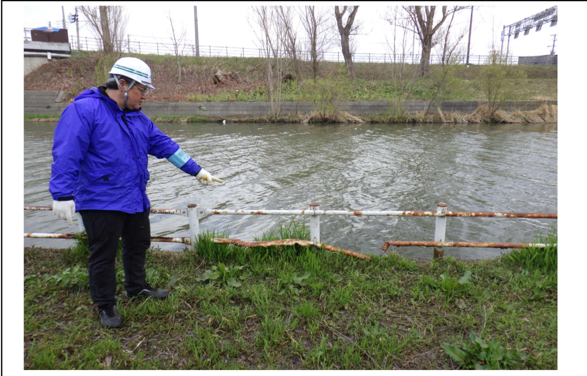
○撮影場所 : 創成川左岸KP0.3付近 ○写真説明 : 柵の損傷