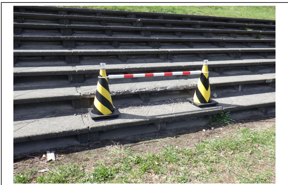
○撮影場所 : 豊平川左岸KP16.7付近 ○写真説明 : 階段護岸の損傷