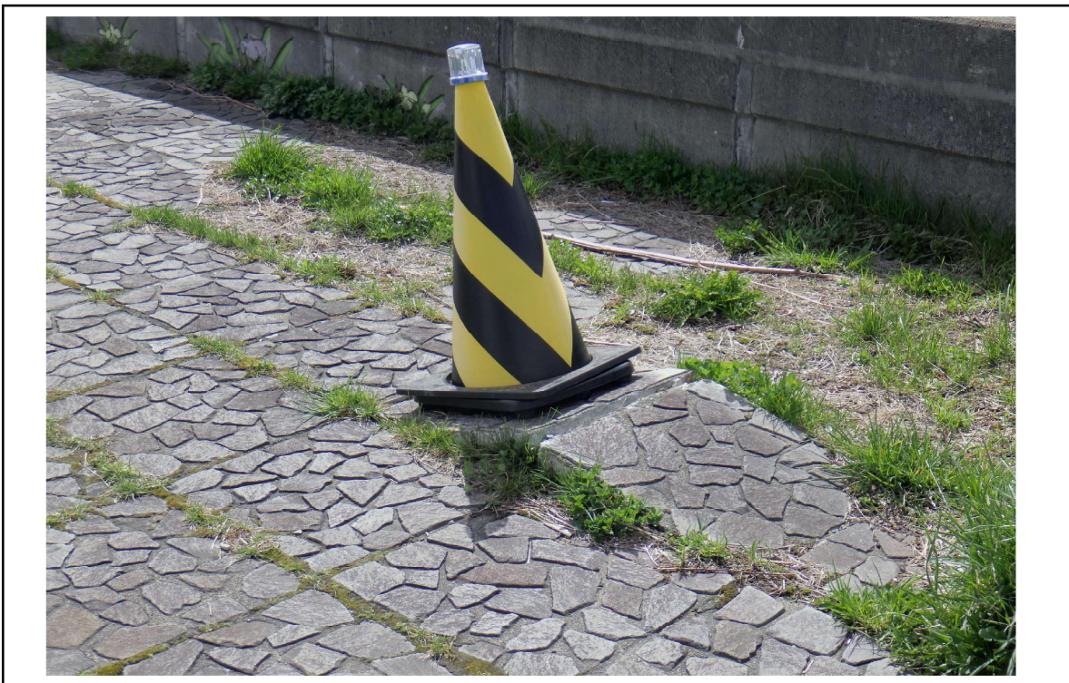
○撮影場所 : 月寒川右岸KP2.1 ○写真説明 : 平板ブロック浮き上がり