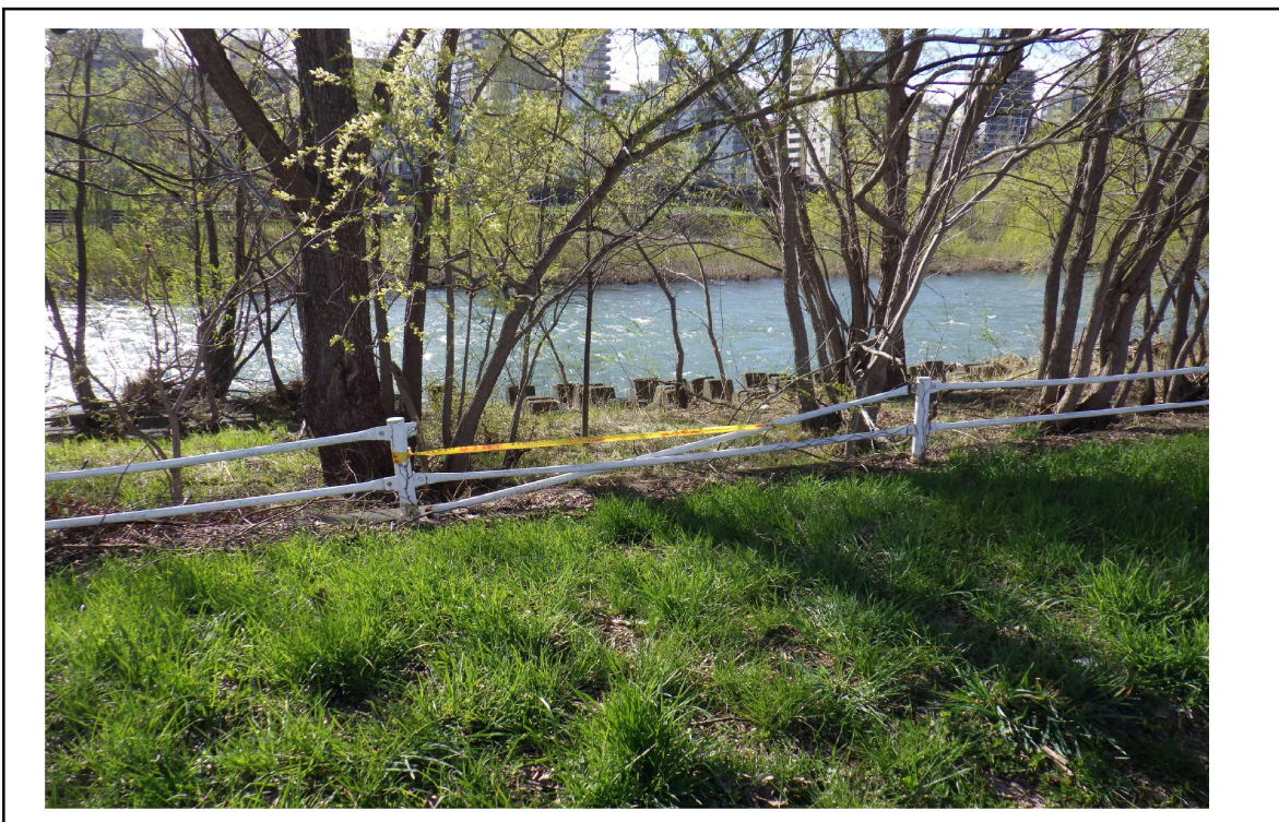
○撮影場所 : 豊平川右岸KP16.1付近 ○写真説明 : 柵の損傷