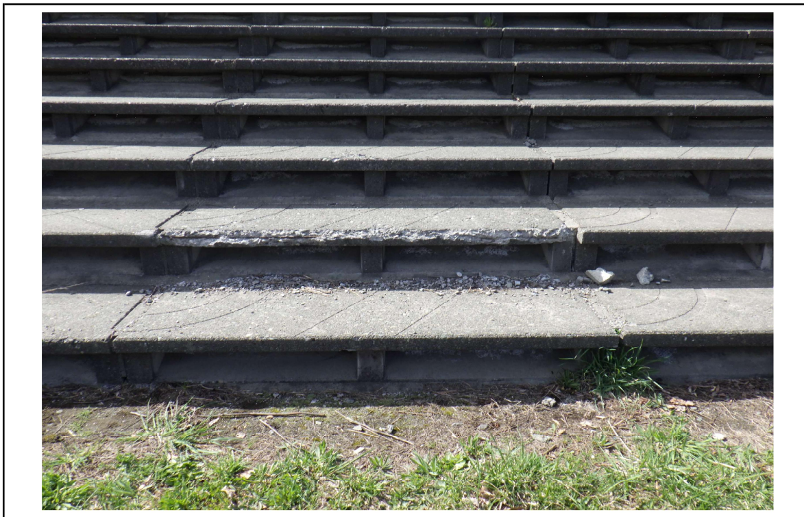
○撮影場所 : 豊平川左岸KP16.7付近 ○写真説明 : 階段護岸の損傷