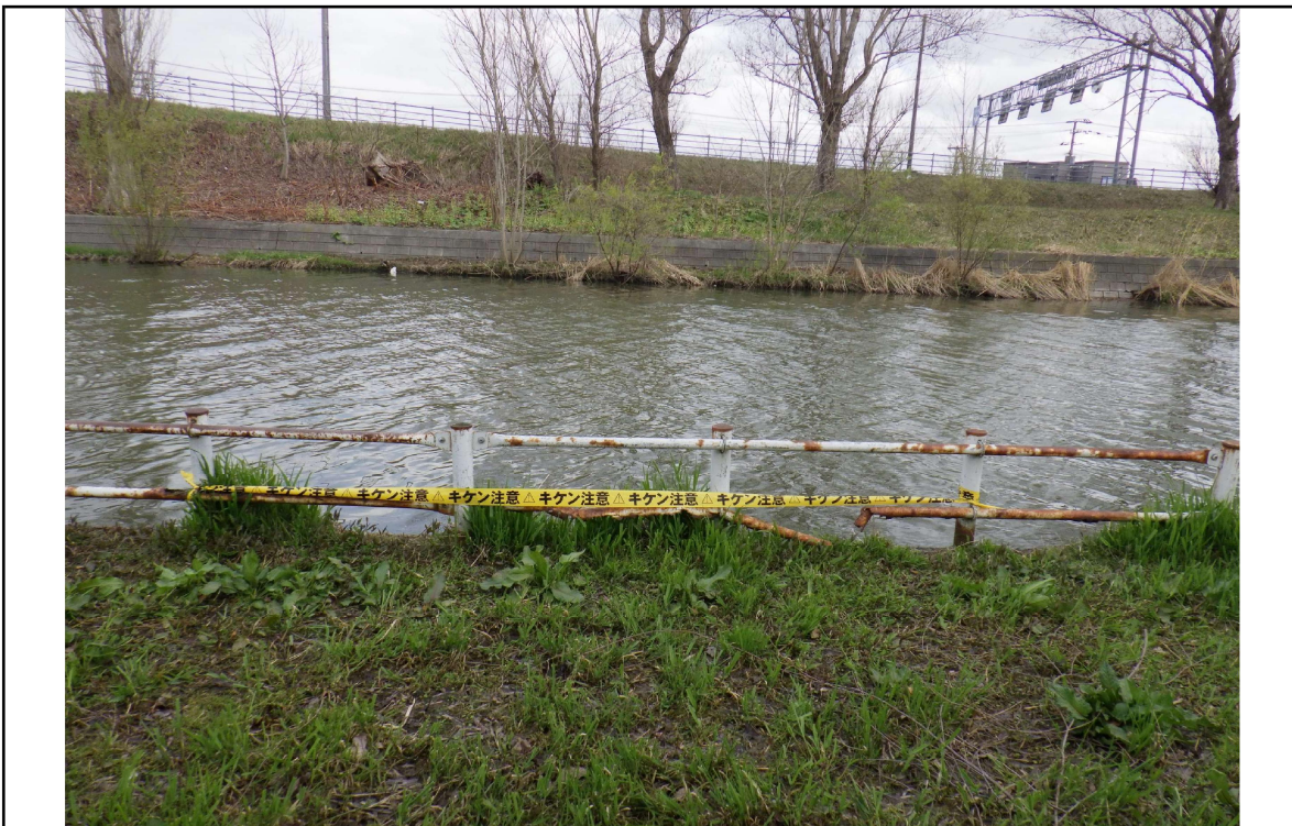
○撮影場所 : 創成川左岸KP0.3付近 ○写真説明 : 柵の損傷