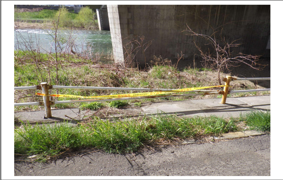
○撮影場所 : 豊平川右岸KP14.7付近 ○写真説明 : 柵の損傷