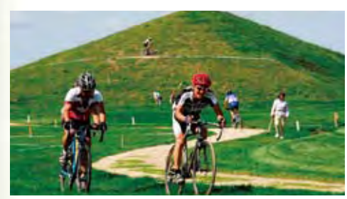
北長沼水郷公園(長沼町)

穏やかに流れる石狩川流域では、リバーセーリングや川下りなども人気。また、川沿いには河川敷公園をはじめとする緑のフィールドが広がっており、パークゴルフや各種スポーツ、釣り、キャンプ、川遊び自然散策など多彩なアウトドアのひとときを提供。時代の面影も各所に残され歴史に感じることが出来るほか、河川敷の空間は各種イベントにも利用され賑わいをみせるなど、多くの人が健康的に楽しめる憩いの空間として親しまれています。