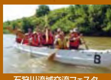
石狩川流域交流フェスタ

●問合せ/ NPO法人「水環境北海道」(011)271-8690 http://www.do-mizukan.com/