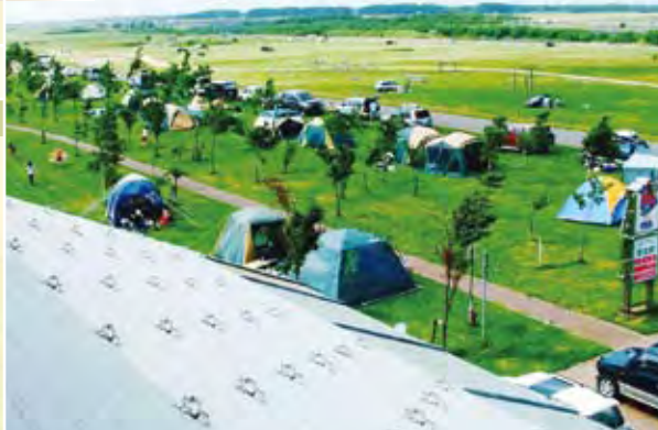
三重湖公園キャンプ場(南幌町)

穏やかに流れる石狩川流域では、リバーセーリングや川下りなども人気。また、川沿いには河川敷公園をはじめとする緑のフィールドが広がっており、パークゴルフや各種スポーツ、釣り、キャンプ、川遊び自然散策など多彩なアウトドアのひとときを提供。時代の面影も各所に残され歴史に感じることが出来るほか、河川敷の空間は各種イベントにも利用され賑わいをみせるなど、多くの人が健康的に楽しめる憩いの空間として親しまれています。