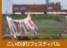
こいのぼりフェスティバル

●問合せ/ こいのぼりフェスティバル実行委員会事務局 (011)381-1069 (江別市教育委員会生涯学習課)