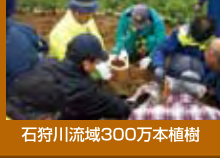
石狩川流域300万本植樹

●問合せ/ 石狩川流域300万本植樹inえべつ実行委員会事務局 (011)382-1046 (江別市生活環境部環境室環境課)