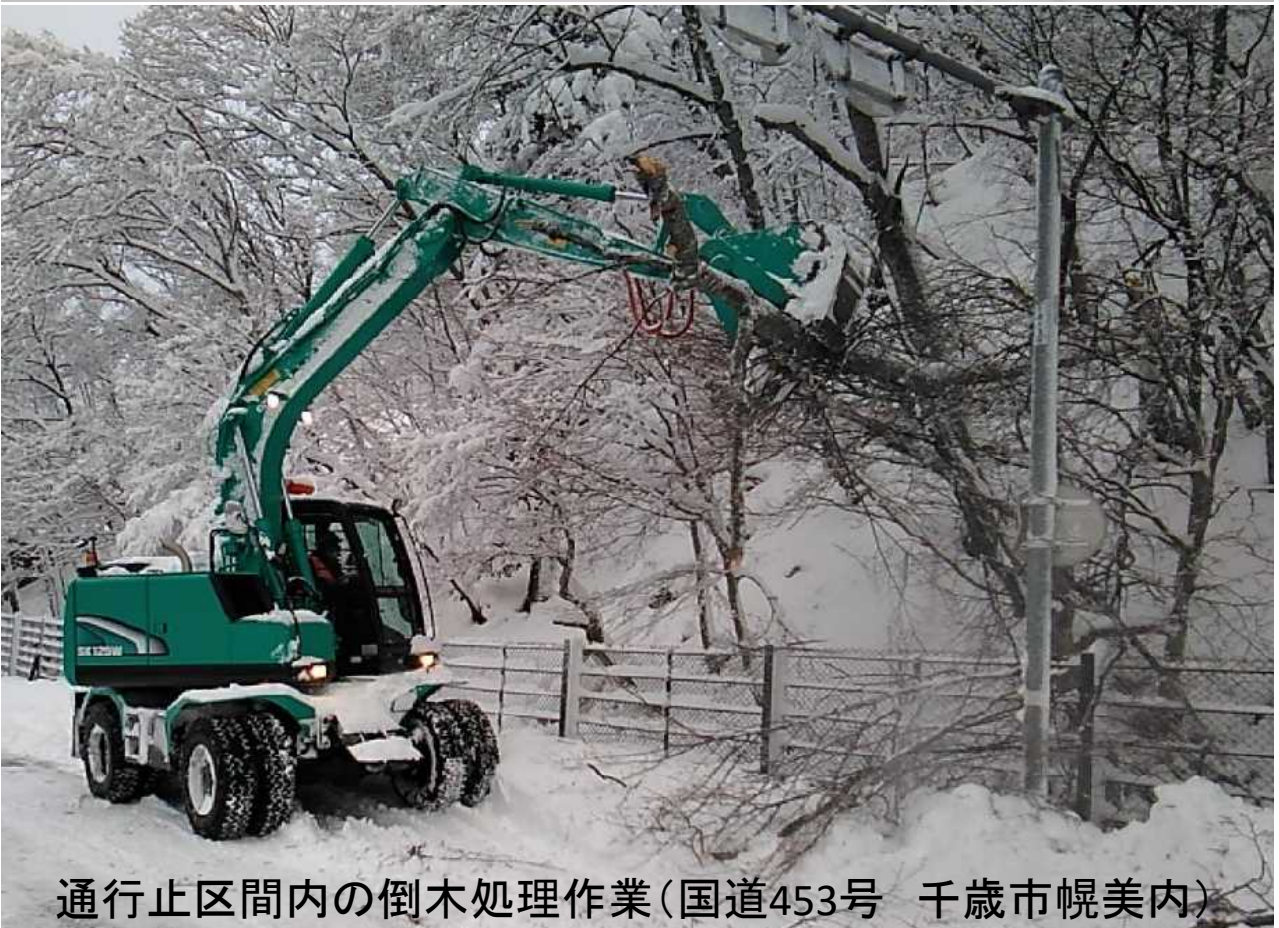
通行止区間内の倒木処理作業(国道453号 千歳市幌美内)