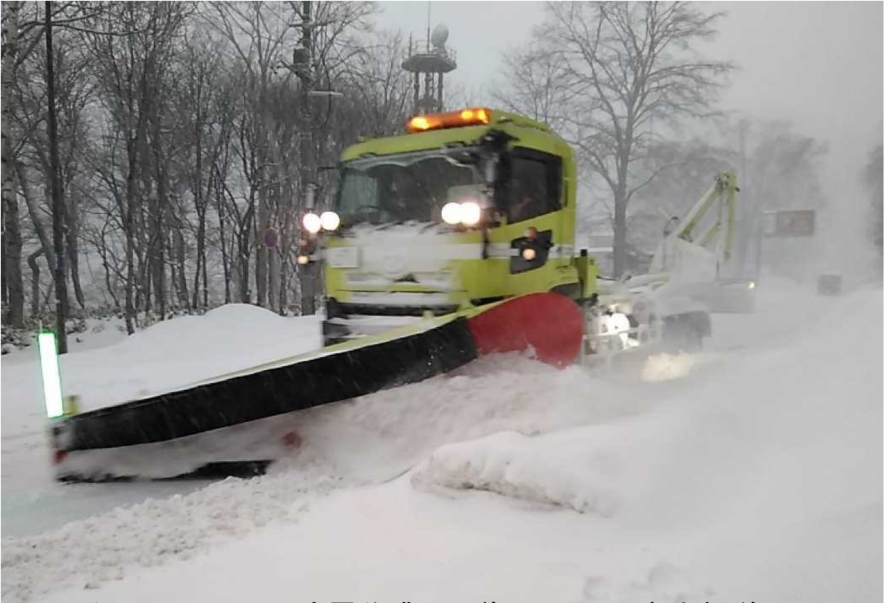
通行止区間内の除雪作業(国道453号 千歳市幌美内)