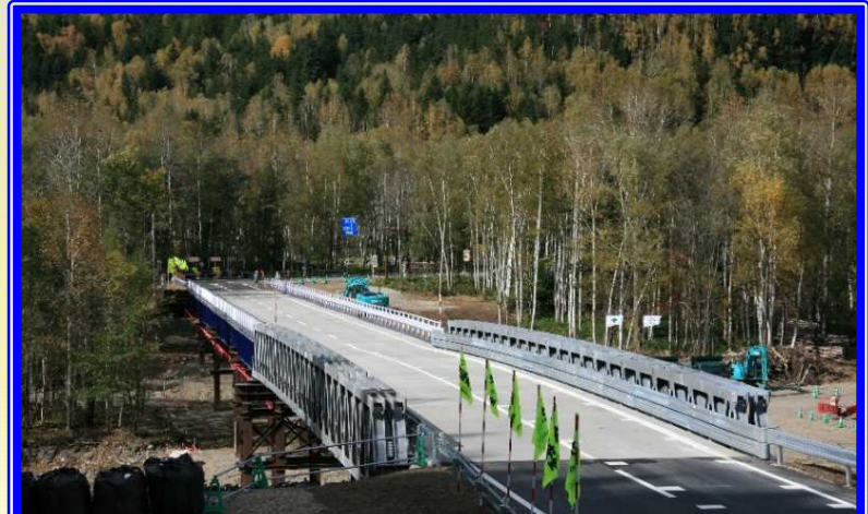
H28 国道273号上川町高原大橋架設状況