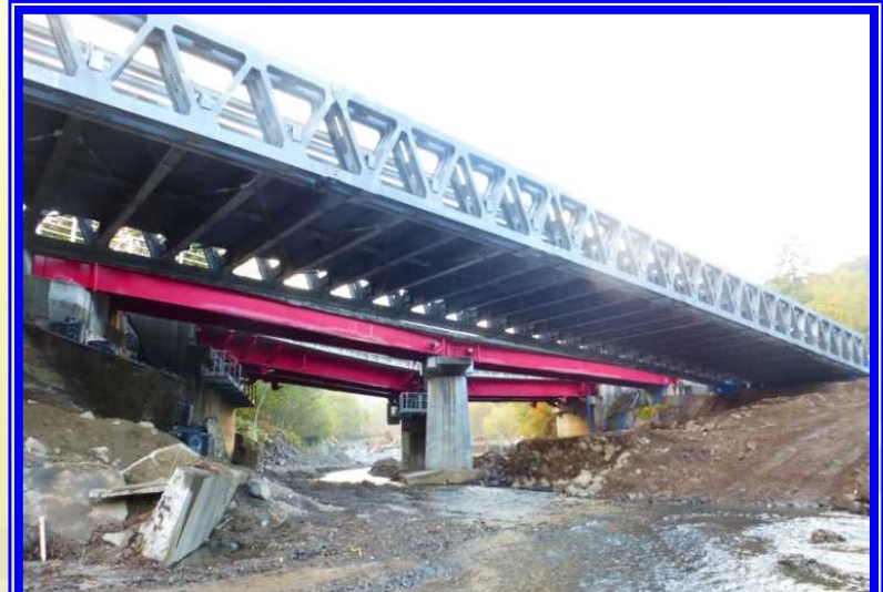
H26 国道453号恵庭市奥漁川橋架設状況