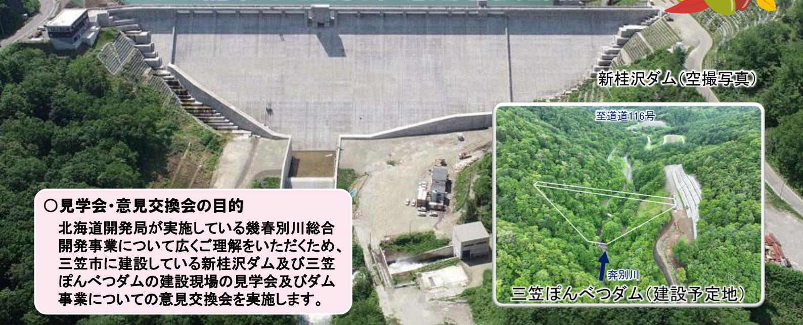
新桂沢ダム(空撮写真)