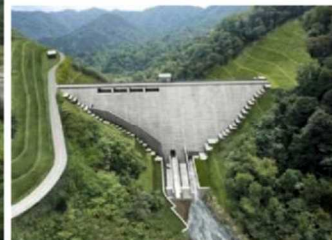
三笠ぽんべつダム