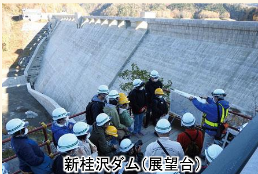
新桂沢ダム(展望台)