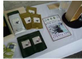
販売中の熟成茶葉