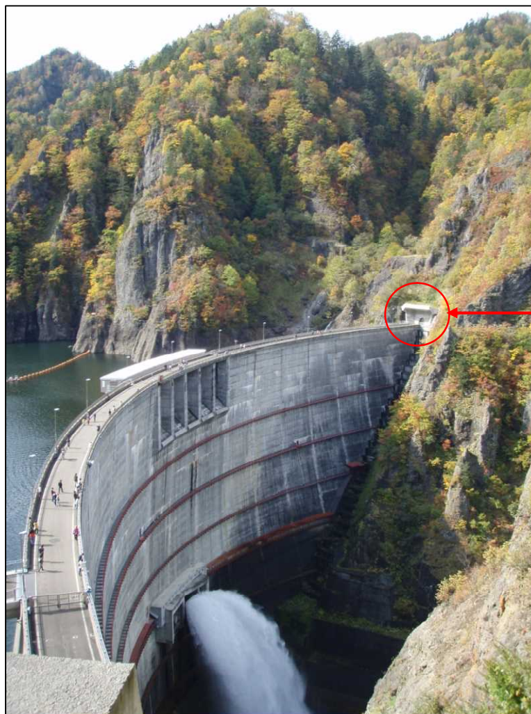
貯蔵実験場所 作業用トンネル