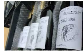
搬出された貯蔵ワイン

ワインの官能試験では「2年貯蔵したことで、よりバランス良くまとまっており、今が飲みごろ。」、日本茶葉の官能試験の結果は「1年熟成したことで、うま味と甘みが増えている。一般の方が飲んでもわかるくらいに明らかに美味くなっている。」とそれぞれ高い評価