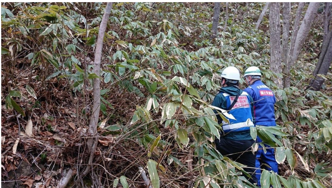
法面点検・調査状況