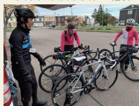
サイクリングガイドセミナー(実地)