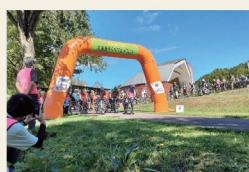
そらちグルメフォンド