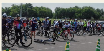
100km サイクリング in 旭川

サイクルイベントを開催し、国内外のサイクリストを誘致する一方、サイクリングガイドの育成にも力を入れています。