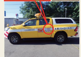
サイクリスト応援カー