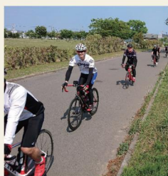
TOUR OF KAMUI 2022 石狩大会