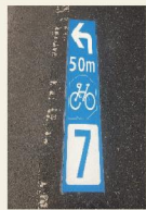
路面表示による案内