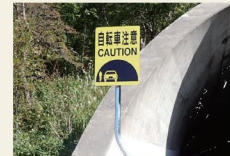
トンネル前の注意喚起看板