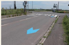
交通量の多い交差点

これらにより、この道路がサイクリングルートであることを車のドライバーに示し、安全な自転車走行環境の創出を図っています。