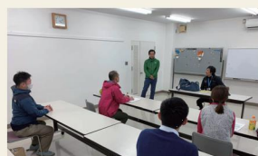
サイクリングガイドセミナー(座学)