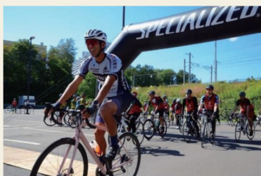
ツール・ド・キタヒロ