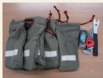
簡易自転車修理キット