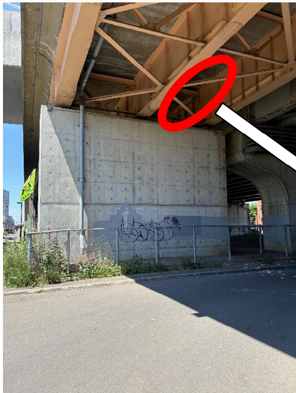
コンクリート片剥離箇所