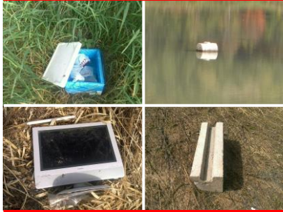
空知川管内に捨てられたごみ