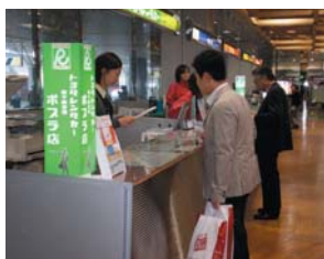
1 機場的租車櫃台(新千歲機場)