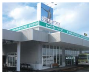
3 租車公司的所在地