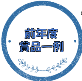
中頓別町賞 (黄金のケーキ・ハチミツスティックなど) 枝幸町賞 (かに・ほたて炊き込みご飯の素など) 稚内市賞 (ほたて丸など稚内ブランド)