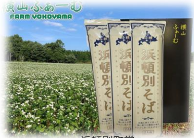
浜頓別町賞 (浜頓別そば 浜頓別町で栽培したそばを使用)