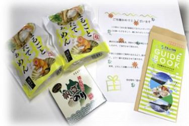
猿払村賞 (まるごとほたてらめめん・帆立のり)