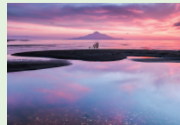
【夕焼けリフレクション】

シーニックバイウェイ北海道「宗谷シーニックバイウェイ」「萌える天北オロロンルート」「大雪・富良野ルート」「天塩川シーニックバイウェイ」の、道北4ルートが連携したフォトコンテストを実施致します。上記の2ルート以上で撮影した作品をお送り下さい。(平成30年に撮影したもの) 入賞された方の作品は、大伸ばし写真パネルを作成し、パネル展等を実施します。尚、グランプリに選ばれた方には各ルートの地域特産品、合計2万円相当をプレゼント致します!!