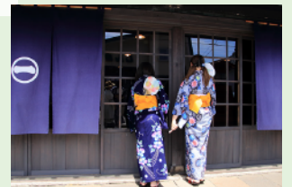
【涼 風】