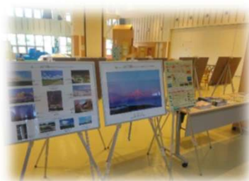
2025年6月9日～6月20日 浜頓別町交流館