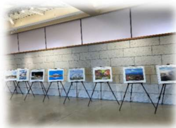
2025年8月5日～8月17日 丘のまち交流館bi.yell