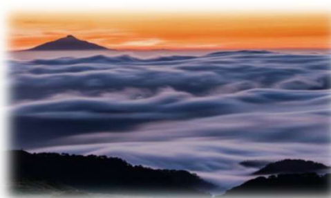
2022年グランプリ作品 【天空の波濤】