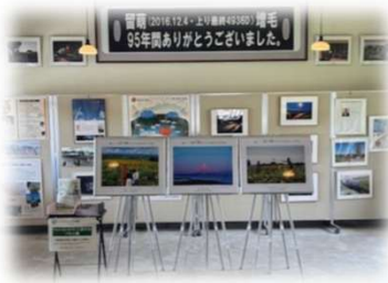
2025年9月4日～9月11日 増毛駅