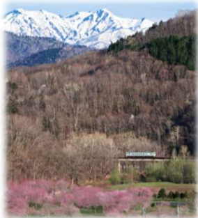
2025年グランプリ作品 【最後の春の美しさ、永遠に】