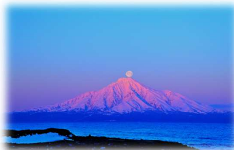
2024年グランプリ作品 【白銀玉】

フォトコンテスト受賞作品は写真パネルにして「道の駅」や各地域の観光施設で展示を行っています。