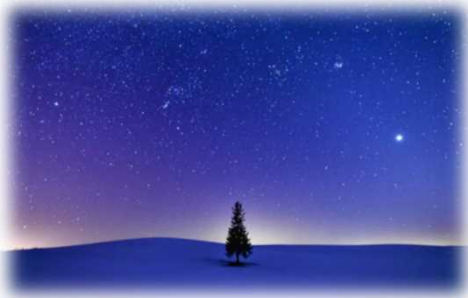
2020年グランプリ作品 【星空のステージ】