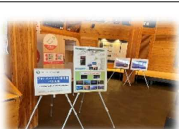
2022年8月3日～8月31日 道の駅「おびら練番屋」