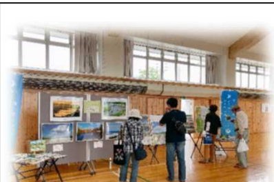
2022年9月3日～9月4日 幌加内新そば祭り