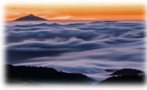
2022年グランプリ作品 【天空の波濤】