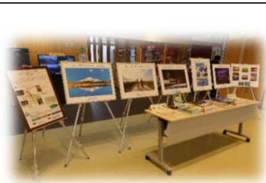
2022年6月13日～6月24日 道の駅「北オホーツクはまとんべつ」