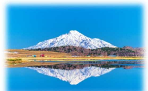
2021年グランプリ作品 【早春の逆さ富士】

フォトコンテスト受賞作品は写真パネルにして道の駅や観光拠点での展示を行っています。