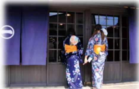
2017年グランプリ作品 【涼風】