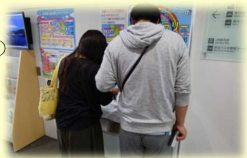
地域限定スタンプラリー中の参加者

◇スタンプラリーが 出かけるきっかけ になるのでぜひ続けてほしいです。(道内・30代男性)