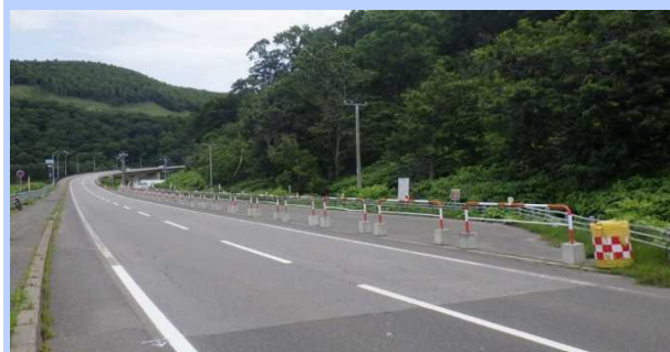
(参考) 昨年度の利用制限状況