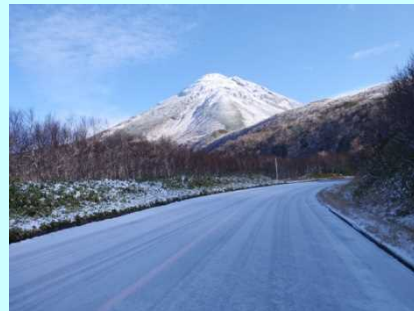
積雪時の状況(初冬)