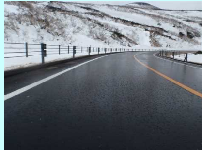
ブラックアイスバーンの状況