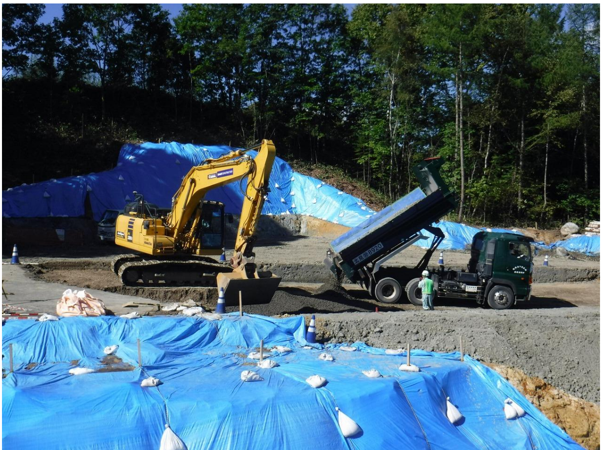
△ 道路復旧状況(路盤工)