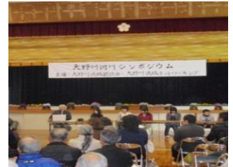
シンポジウムの開催