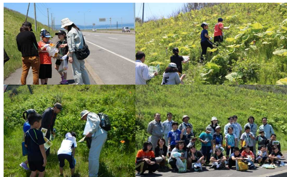
植物観察会の様子(平成28年6月)