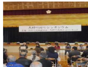
シンポジウムの開催