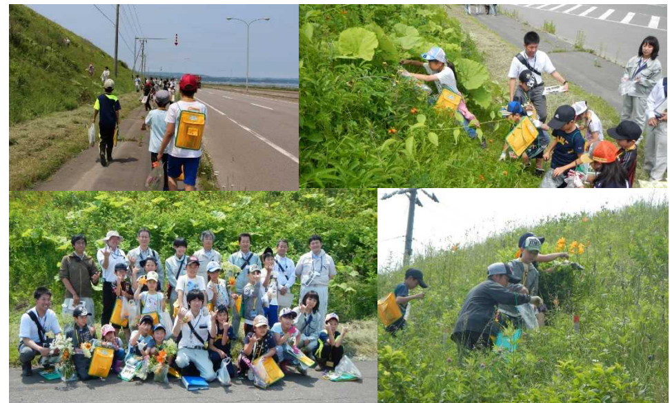
植物観察会の様子(平成29年7月)