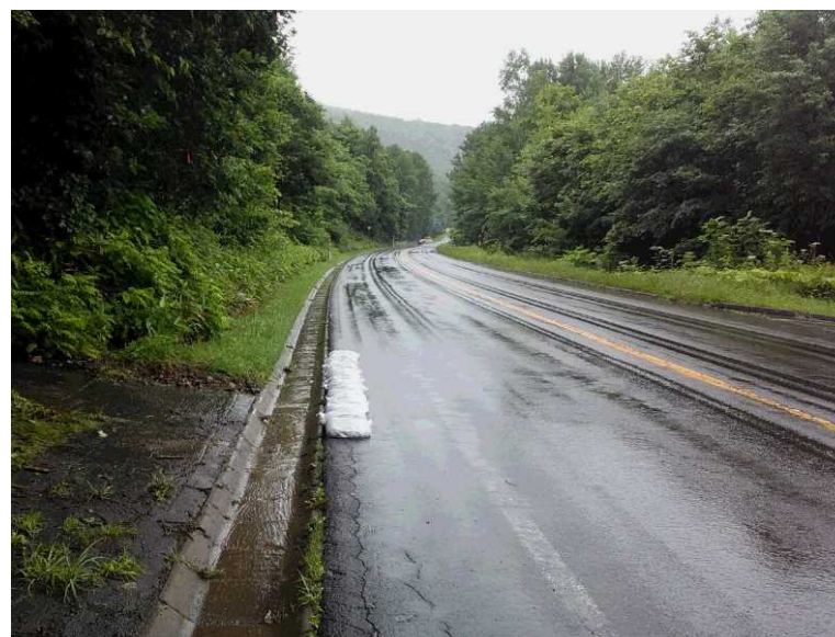
国道333号(KP33.2) 応急復旧完了

【土砂流出規模】 延長=約10m 幅=約10m 高さ=約0.1m 体積=約10m 3