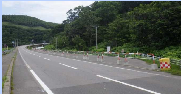
(参考) 昨年度の利用制限状況