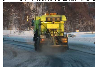
〈凍結防止剤散布車〉

凍結防止剤散布車で坂道や交差点部などで発生したツルツル路面へ凍結防止剤(塩化ナトリウム等)や防滑材を散布します。