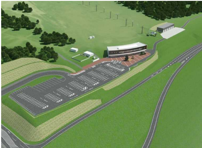
※身障者・妊婦用優先駐車場(4台)は屋根付