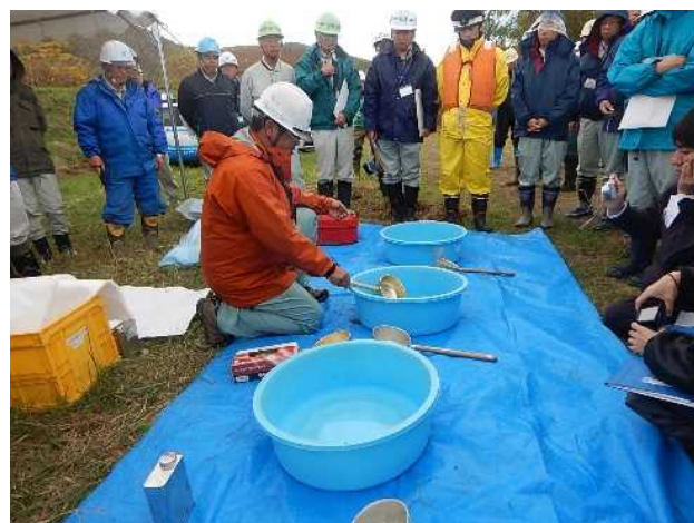
油分等の簡易水質調査の実演