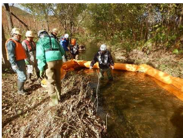
現地対策訓練（オイルフェンス設置）