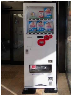
子育て応援自動販売機（イメージ）