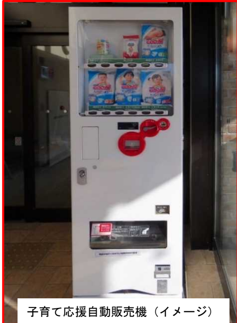
子育て応援自動販売機（イメージ）