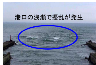
港口航路の擾乱状況