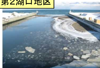
低気圧による航路埋没状況