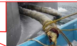
アイスブームの被害