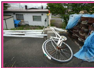
廃棄車両: 自転車の放置