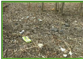
一般ゴミ: 家庭ゴミ