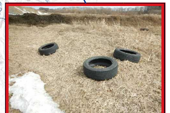
処理困難物: タイヤ