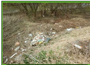
一般ゴミ: 家庭ゴミ