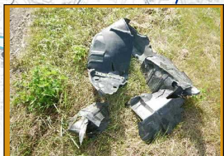
粗大ゴミ: 車の部品