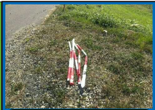
産廃ゴミ: スノーポール