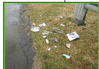
一般ゴミ: 家庭ゴミ