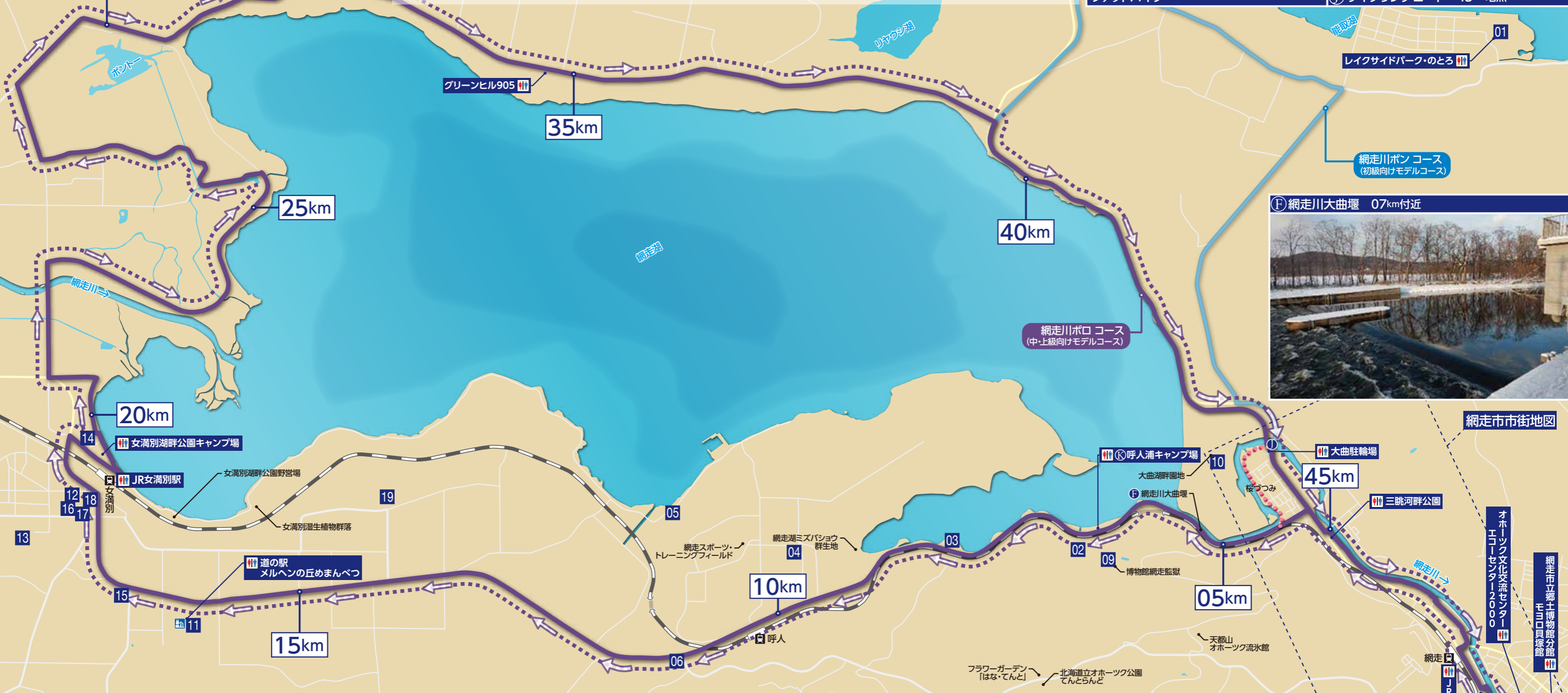
⑦ 網走川大曲堰 07km付近