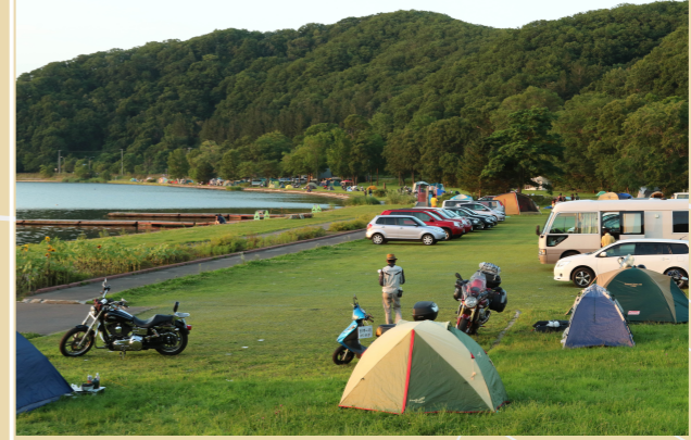
Start / Goal