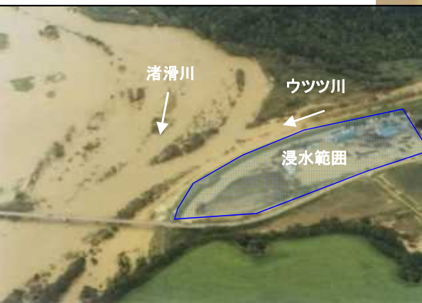
平成10年9月台風 被害家屋197戸、氾濫面積310ha