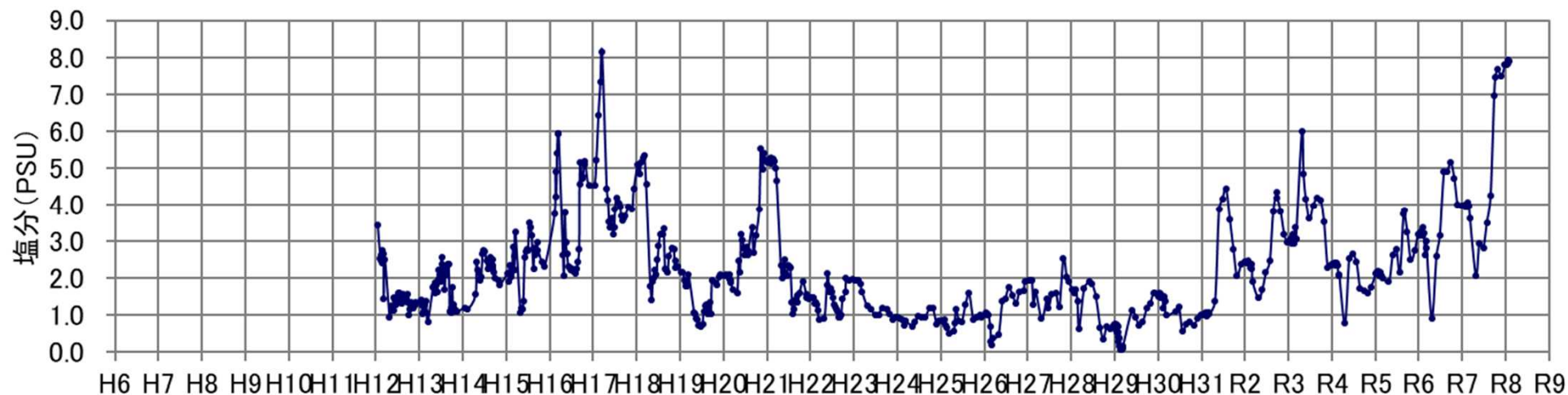
網走湖の塩分変化（水深2.0m）

※ 図中の青丸は、日誌より魚類斃死等の記述があるものを参考にした。なお、水色網掛は塩淡水境界層の目標水深を示す。