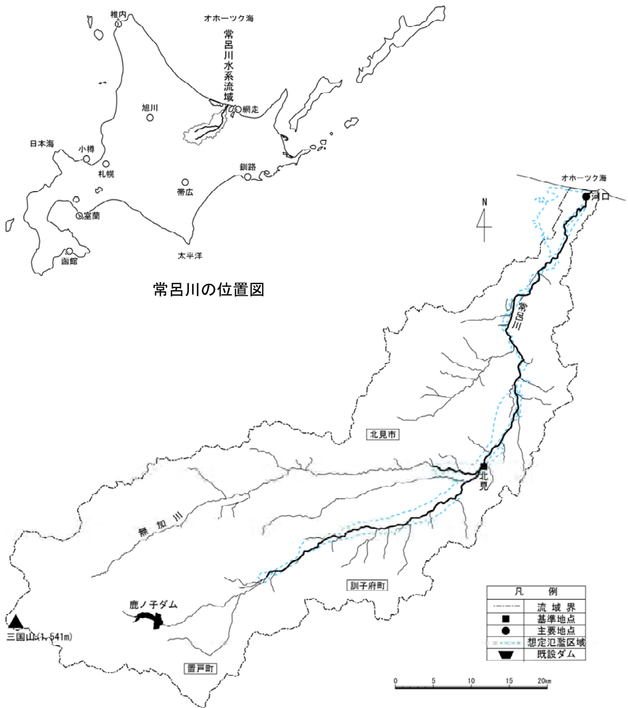
(参考図) 常呂川水系図