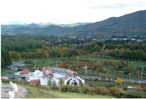
写真 7-1 溪谷公園

渚滑川における河川利用状況は、主に採草地として利用されているが、緑あふれる自然が豊富にあることが特徴的であり、上流の滝上町では、パークゴルフ場やキャンプ場を備えた溪谷公園や遊歩道が川に沿ってあり見事な溪谷美と溪流、大小の滝を見ようと多くの人々が訪れている。また、河川空間を利用した「芝桜まつり」、「夏に恋まつり」、「溪谷ウオーク」等の様々なイベントが開催され多くの市民に利用されているほか、本格的な溪流釣りの場として多くの人々が訪れ、スポーツフィッシングのメッカとして全国のファンから注目を集めている。