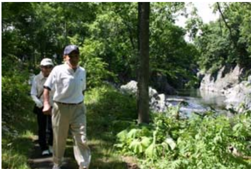
写真 7-3 溪谷ウオーク