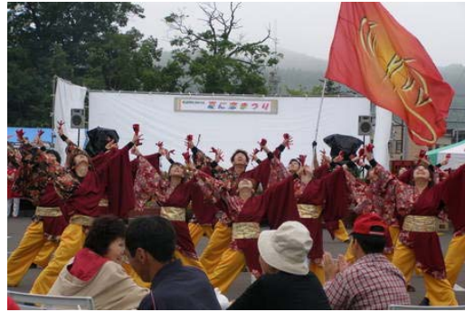
写真 7-2 夏に恋まつり