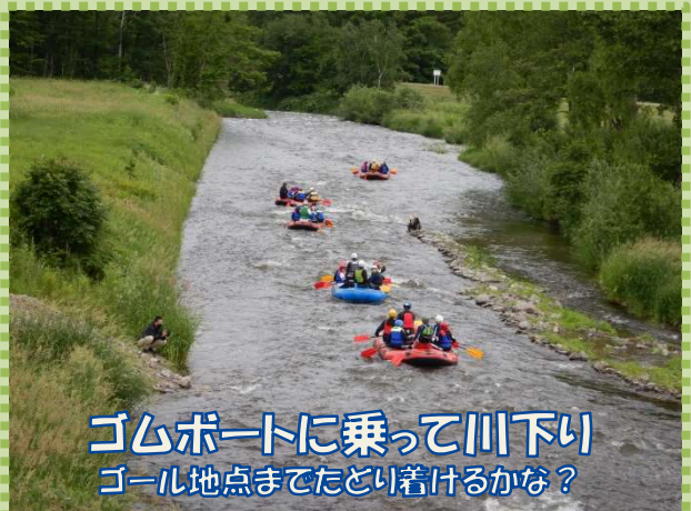
ゴムボートに乗って川下り ゴール地点までたどり着けるかな？