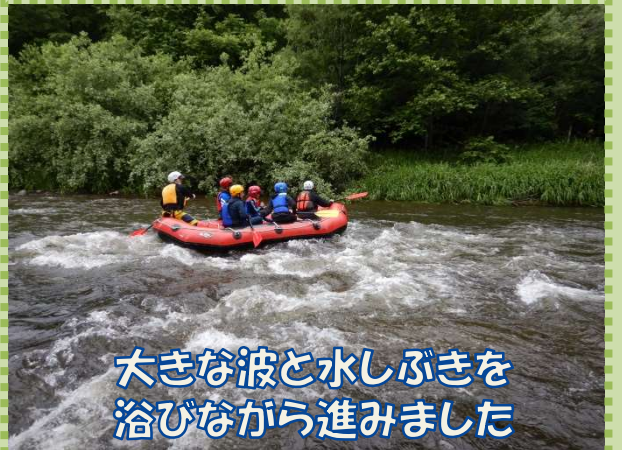
大きな波と水しぶきを 浴びながら進みました

今年度も新型コロナウイルス感染症対策を行いつつの実施でした。当日は前日までの雨の影響で水温が少し低かったですが、児童は楽しみながら常呂川の自然体験学習会を終えました。