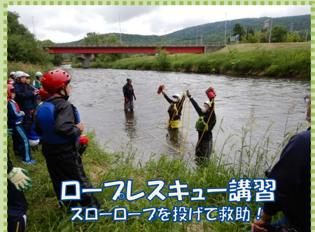
ロープレスキュー講習 スローロープを投げて救助！

拓殖橋から種川樋門までのコースをゴムボートで下りました。普段見ることのできない川からの景色を眺めつつ、川底の石をよけながら川下りを楽しみました。