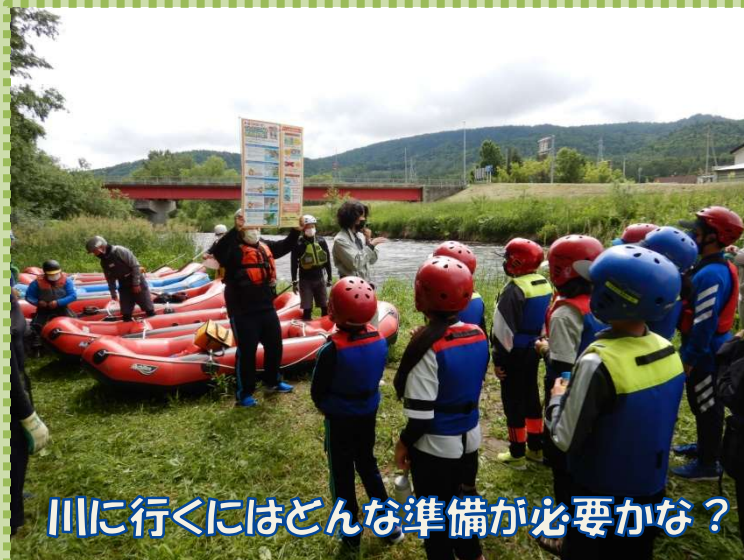
川に行くにはどんな準備が必要かな？

今年度も新型コロナウイルス感染症対策を行いつつの実施でした。当日は前日までの雨の影響で水温が少し低かったですが、児童は楽しみながら常呂川の自然体験学習会を終えました。