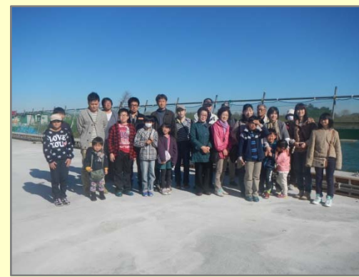
工事中の新蘭栄橋で記念撮影をしました。