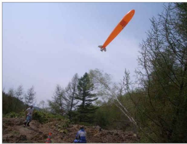
《調査事例：土砂崩れにおける予備調査状況 (バルーンによる写真撮影)》