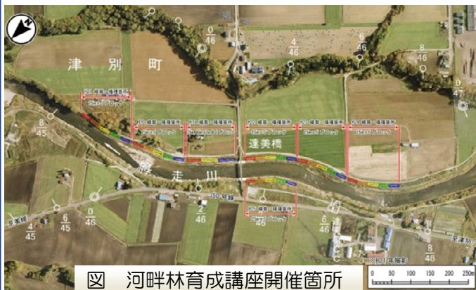
図 河畔林育成講座開催箇所

植樹会では、平成 19 年の植樹箇所で、「ヤナギ類の見分け方・芽鱗痕 がりんこん *の観察」、「ヤナギ類の挿し穂づくり・ヤナギ類の間引き体験」、「生長状況観察」を行ったあと、平成 25 年植樹箇所「オニグルミの種まき」と「ヤナギやエゾノウワミズザクラ」の植樹を行いました。