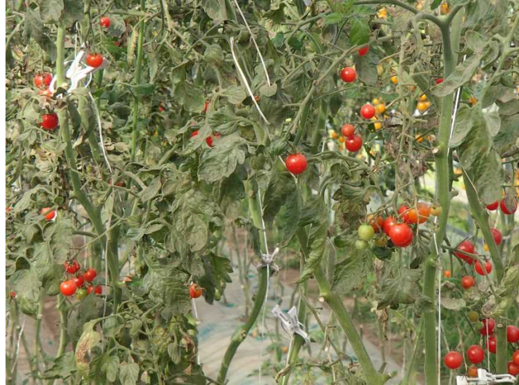
ごんた村ビニールハウス内のミニトマト