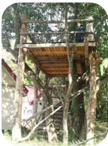
制作中のツリーハウス

また、外国人の宿泊客も積極的に受け入れ、実績を伸ばしており、更に子どもたちが楽しめる事を色々と提供していく予定です。