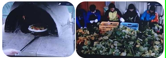
移動式ピザ釜（左）高校生職業体験風景（右）