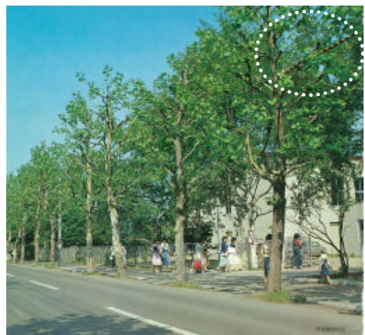
写真：電線迂回型剪定の事例 破線丸印：電線