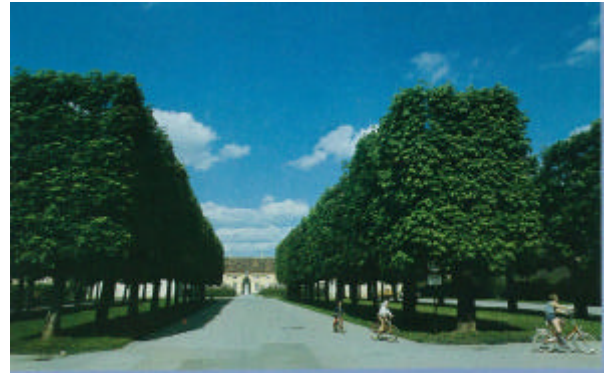
写真：トチノキをブラカード型に剪定した事例〔スイス〕

写真：電線及び車道側の枝を剪定した事例〔土別〕 樹種：ナナカマド 左：剪定前、右：剪定後 破線緑が剪定前外郭線 破線赤が剪定後外郭線