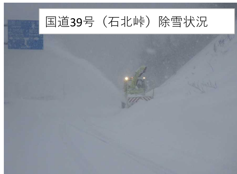
国道39号（石北峠）除雪状況