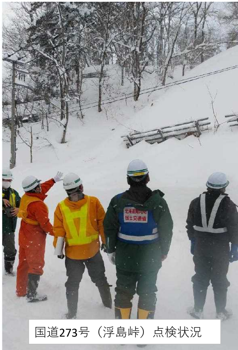
国道273号（浮島峠）点検状況