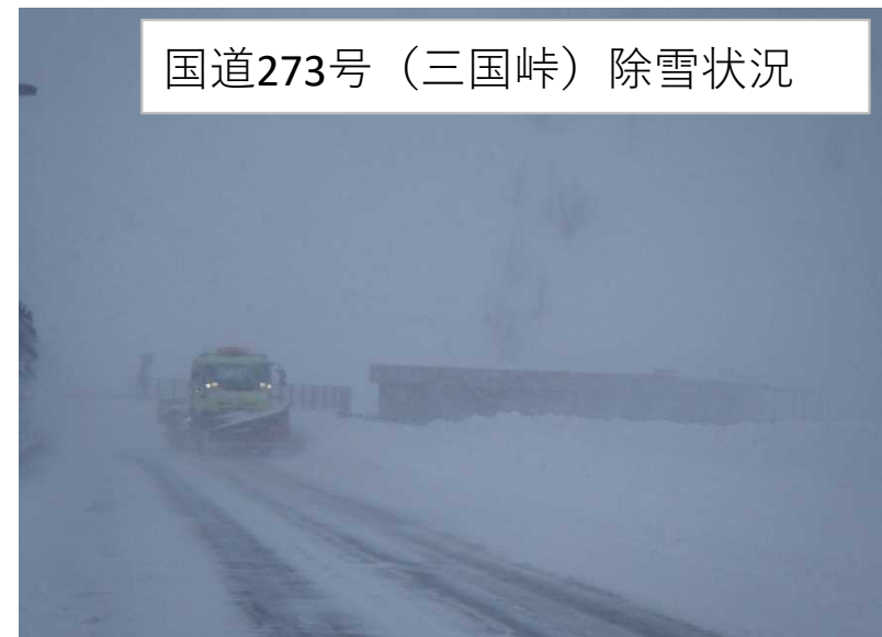
国道273号（三国峠）除雪状況