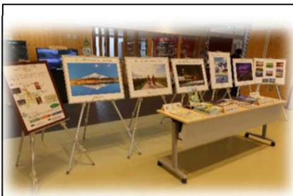
2022年6月13日～6月24日 道の駅「北オホーツクはまとんべつ」