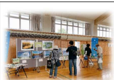
2022年9月3日～9月4日 幌加内新そば祭り