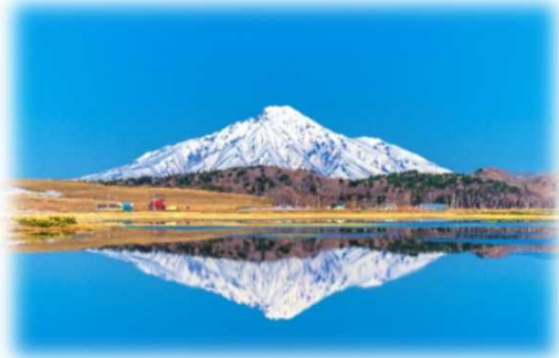
2021年グランプリ作品 【早春の逆さ富士】

フォトコンテスト受賞作品は写真パネルにして道の駅や観光拠点での展示を行っています。