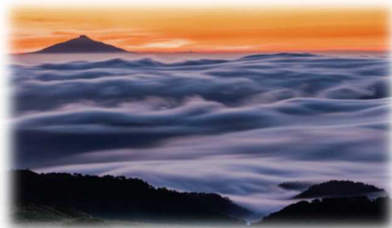
2022年グランプリ作品 【天空の波濤】