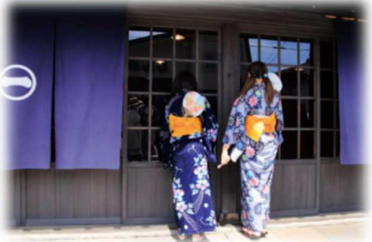
2017年グランプリ作品 【涼風】