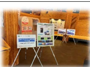
2022年8月3日～8月31日 道の駅「おびら練番屋」