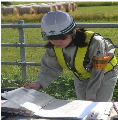
違反判定確認の様子