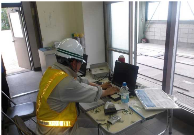
違反判定確認の様子