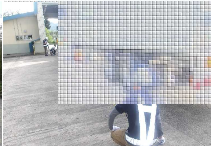
寸法計測の様子（長さ）