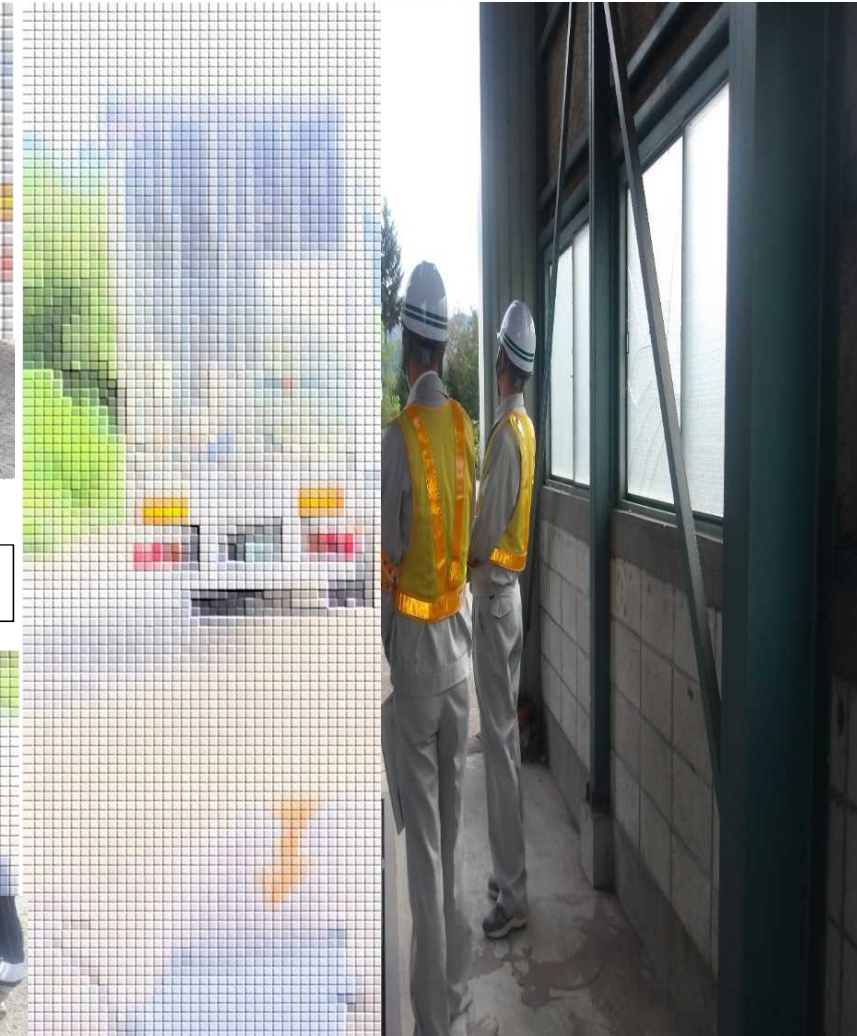
ご協力ありがとうございました！