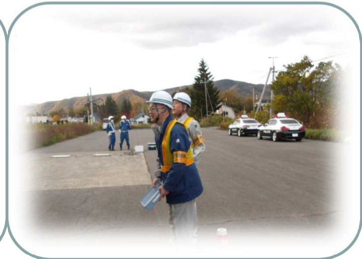
ご協力ありがとうございました！