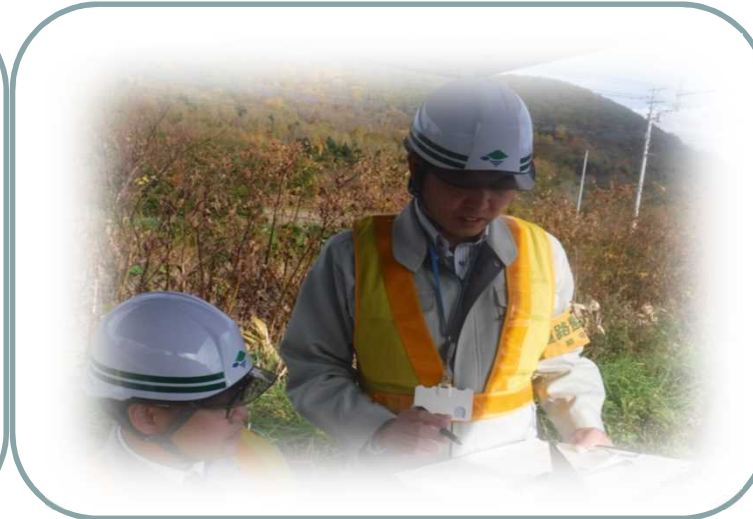
違反判定確認の様子