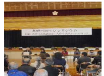
シンポジウムの開催