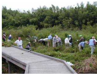
ビオトープの整備