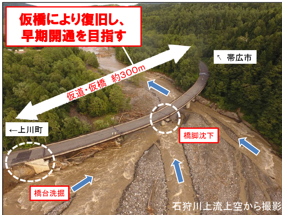
石狩川上流上空から撮影