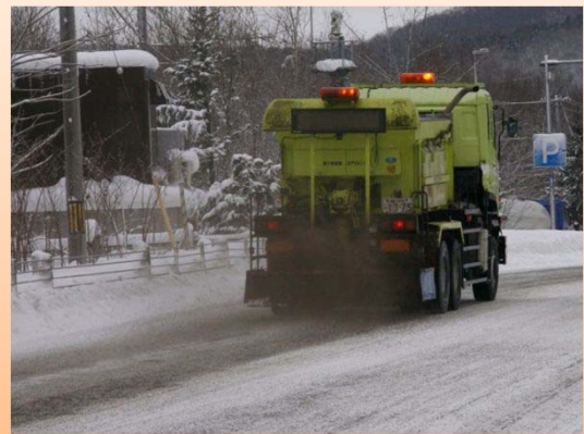
<凍結防止剤散布車>

凍結防止剤散布車により、交差点部などのツルツル路面において凍結防止剤（塩化ナトリウム等）や防滑材（砂）を散布します。